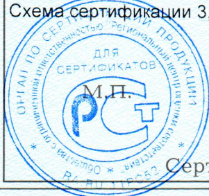
Схема сертификации 3, инспекционный контроль 1 раз в год.

Место нанесения знака соответствия – в товаросопроводительной документации, графическое изображение знака соответствия по ГОСТ Р 50460-92 с надписью «Добровольная сертификация».